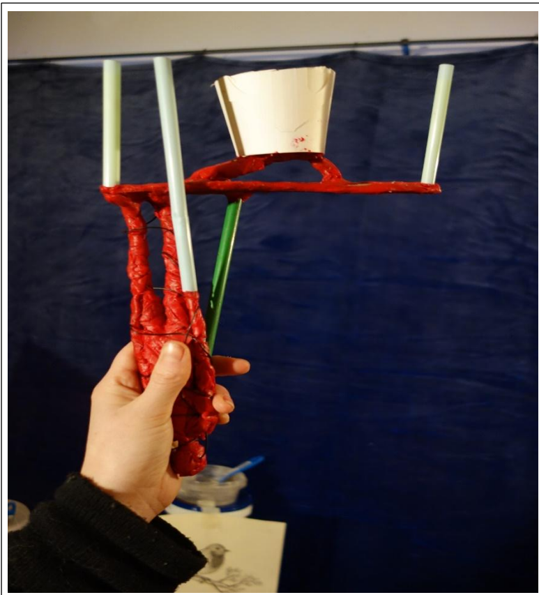
Trichter für die Gussform

Die abgebildete menschliche Skulptur (Abb. 5) ist etwa 20 Zentimeter hoch. Dafür benötigt man zwei Kilogramm feines und fünf Kilogramm grobes Gemisch aus Modelliermasse. Beim Einfließen der Bronze fängt der Holzkohlenstaub Feuer und dadurch verbrennen die Gase, die das Metall freisetzt. Es entsteht eine eher gröbere und rustikale Oberfläche der Skulptur. Lässt man den Holzkohlenstaub weg, erhält man eine hellere und feinere Oberfläche.