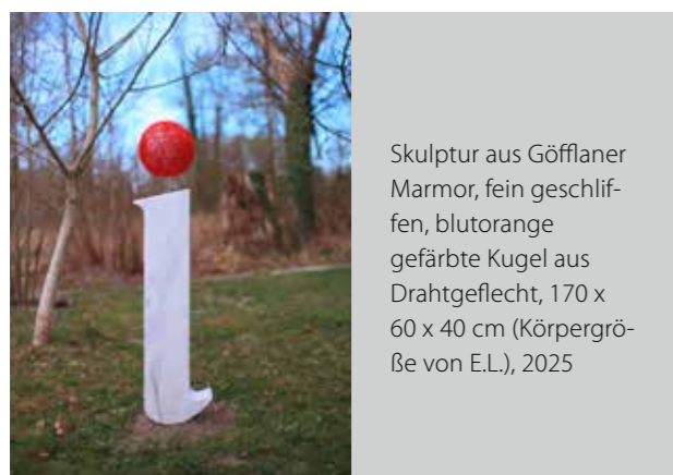
Skulptur aus Göfflaner Marmor, fein geschliffen, blutorange gefärbte Kugel aus Drahtgeflecht, 170 x 60 x 40 cm (Körpergröße von E.L.), 2025

In der Innviertler Mundart ist „ich“ ein schlichtes „I“. Die Skulptur zeigt diesen Buchstaben als dreidimensionales, zu Stein gewordenes Schriftzeichen, und zwar in der Körpergröße der Autorin. Alles, was unter dem Begriff Ich firmiert, verdichtet sich in der minimalistischen Figur eines solitären Buchstabens. Dem Punkt auf dem I kommt allerdings eine entscheidende Rolle zu: Er macht das I erst zu einem vollendeten Ich-Portrait.