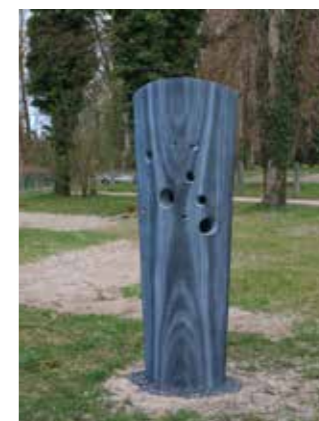
Wachauer Marmor, fein geschliffen, 210 x 70 x 40 cm, 2025

Die Frage könnte hier lauten: Wer bin ich, wenn nicht die Gesamtheit meiner unmittelbaren Umgebung? Ich, das sind die anderen, werfen wir doch einen scharfen Blick auf sie!