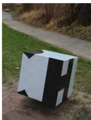
Laaser Marmor und Belgisch Granit, fein gebürstet, 90 x 90 x 90 cm, 2025

Rudolf Wienerroither , Steinmetzmeister aus Frankenburg, unterzieht das ICH mehreren Versuchen. Aus Papier faltet er zunächst die darauf gezeichneten Buchstaben in achtundzwanzig möglichen Varianten, bis er schließlich eine davon in Stein übersetzt: Dennoch bleibt das ICH fragmentiert und stets in Bewegung. Die Schwere des Steins, die dem Gewicht des Selbst entspricht, wird zugleich durch das Würfelspiel konterkariert. Wienerroither: „Ein ICH kann erst durch eine Definition entstehen, doch die Grundlage dieser Definition bleibt grenzenlos.“