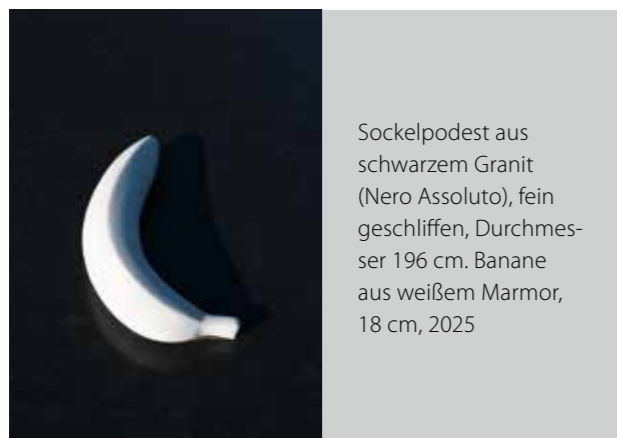
Sockelpodest aus schwarzem Granit (Nero Assoluto), fein geschliffen, Durchmesser 196 cm. Banane aus weißem Marmor, 18 cm, 2025

weiter als eine Banane, auf deren Schale so manche ausrutschen; ein Ich, das andere wegtragen, verzehren oder einfach ignorieren können, wäre es nicht versteinert. Der runde schwarze Granitsockel verweist auf das Universum, während sich das bananenförmige Ich unbedeutend vergänglich ausnimmt, als könnte es mit dem nächsten Windstoß weggeblasen werden. Welchen Wert hat mein Ich?