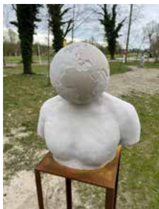
Büste aus Untersberger Marmor, Unterkonstruktion aus Cortenstahl, Gesamthöhe 189 cm, 2025

Auf einem Sockel aus Stahl thront eine klassisch anmutende Büste aus Marmor, ganz wie sie Bildhauer:innen im Laufe der Kunstgeschichte zwecks Selbstdarstellung fertigten. Anders als herkömmlich gestaltete Portraits bedeutender Persönlichkeiten, die vorwiegend das Äußere einer Person darzustellen versuchten, ist hier eine schlichte Kugel zu sehen. Bei genauerer Betrachtung und Betastung wird klar, dass es sich um eine skalierte Abbildung der Erde handelt.